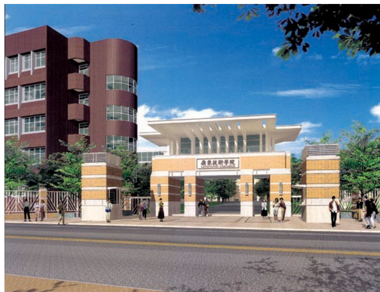
圖 3-5 嶺東科技大學新校門