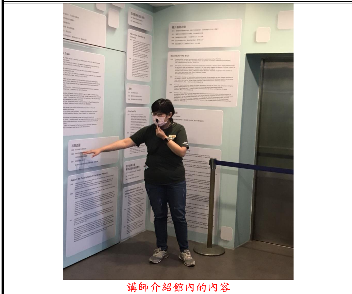
講師介紹館內的內容