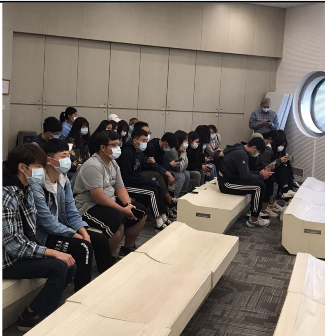
學生上課聽講狀況