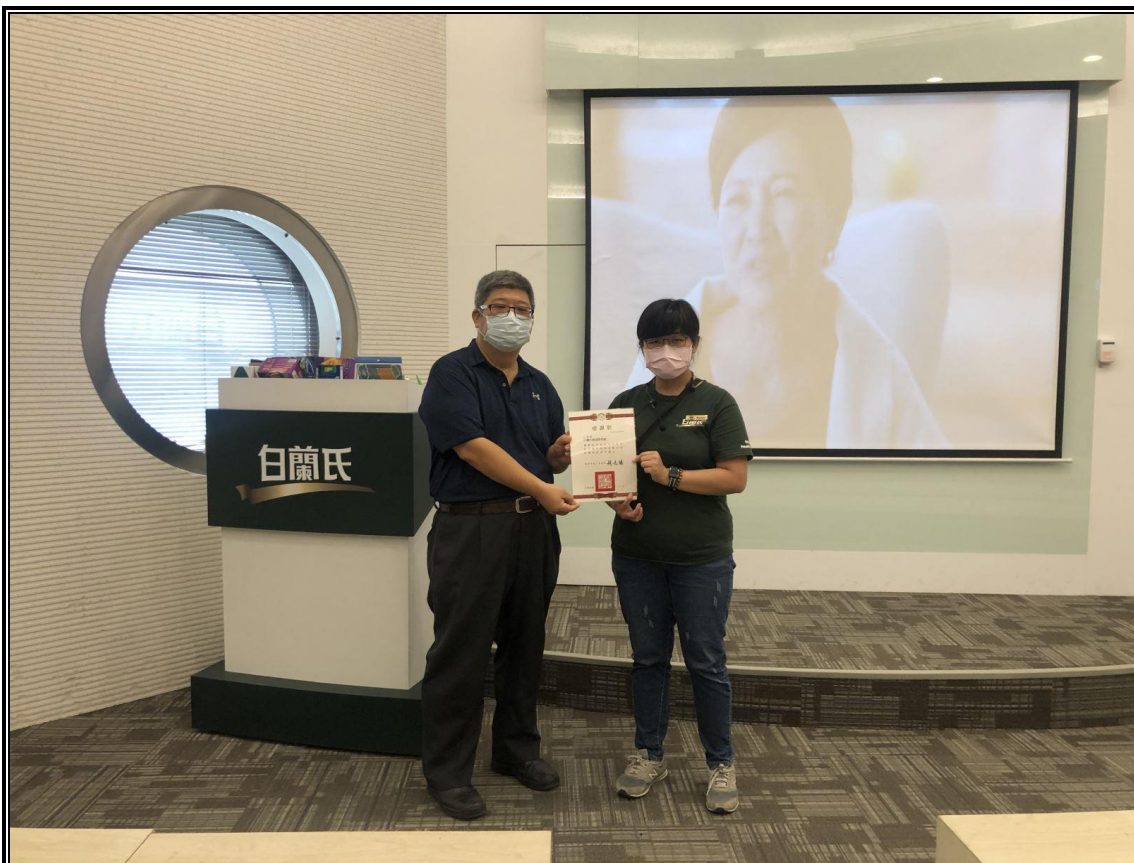
教師頒感謝狀給講師