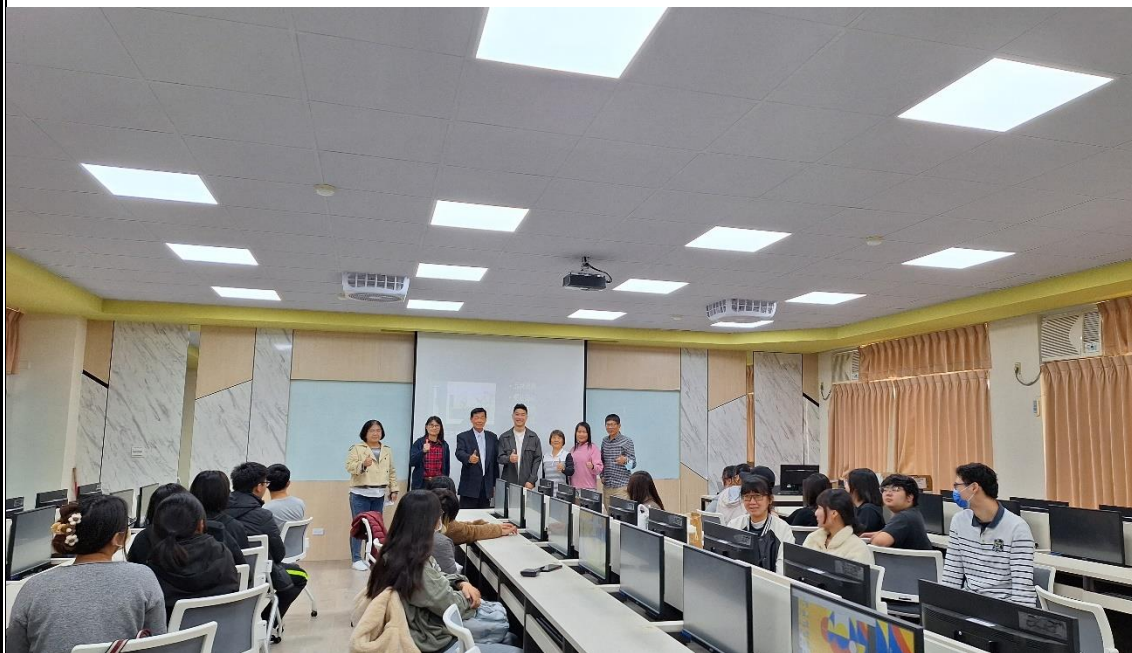
跨境電商精進師生專業社群師生共學培訓活動(二)