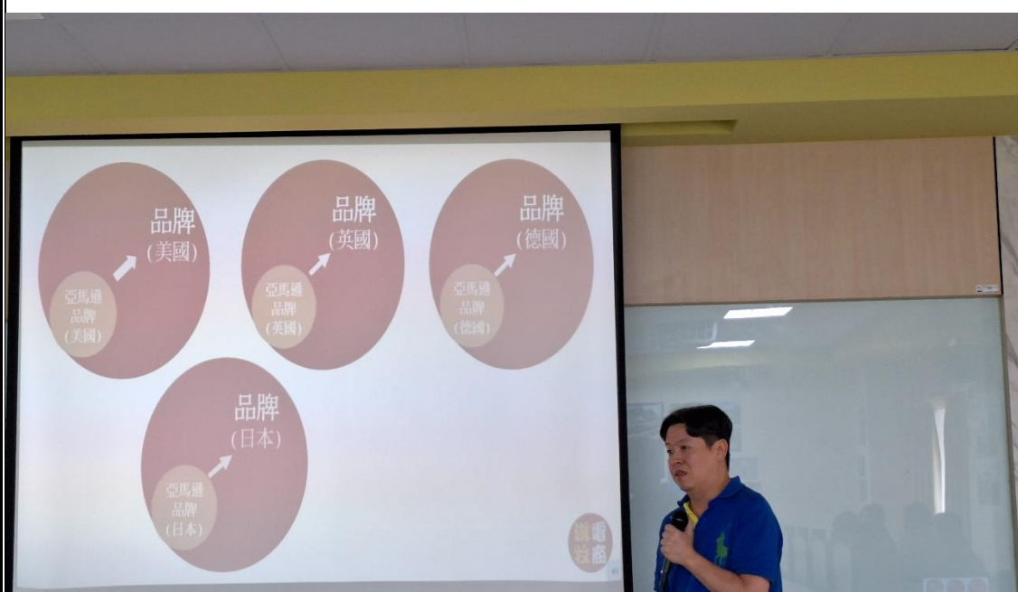
跨境電商精進師生專業社群師生共學培訓活動(六)