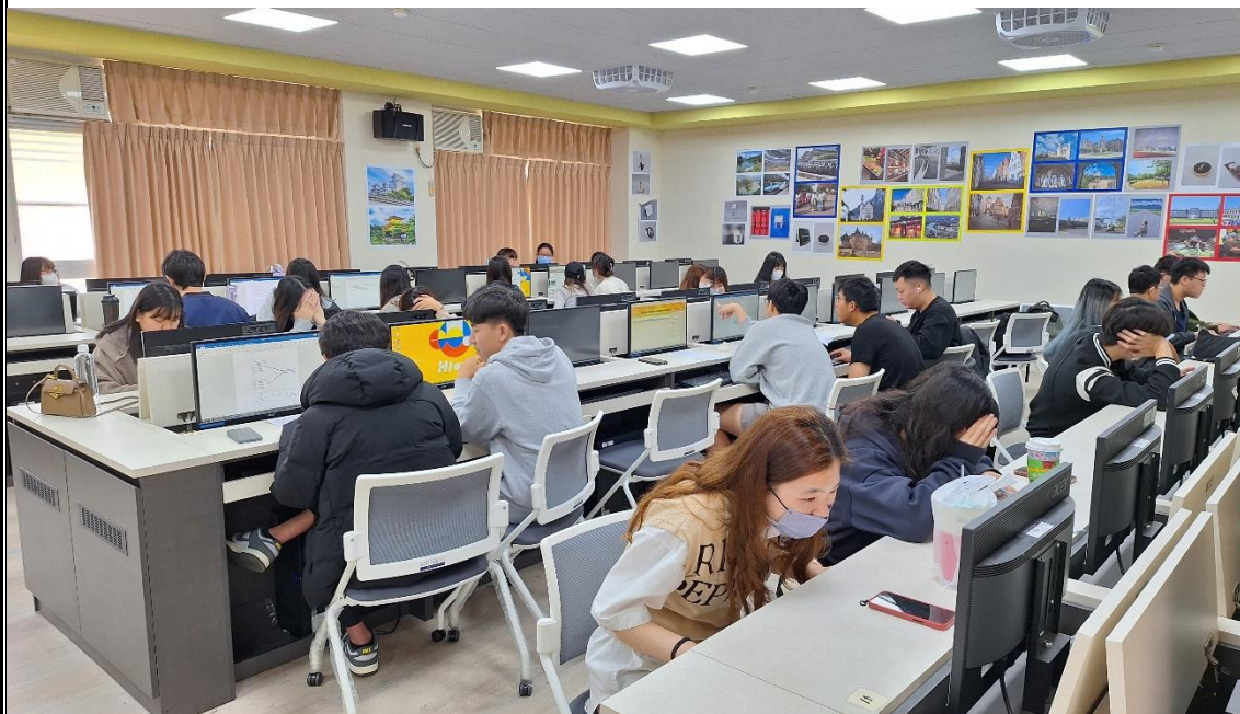
跨境電商精進師生專業社群師生共學培訓活動（一）