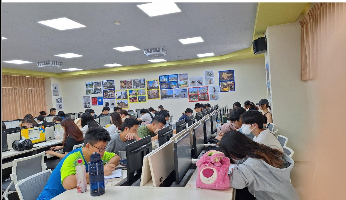
跨境電商精進師生專業社群師生共學培訓活動(五)