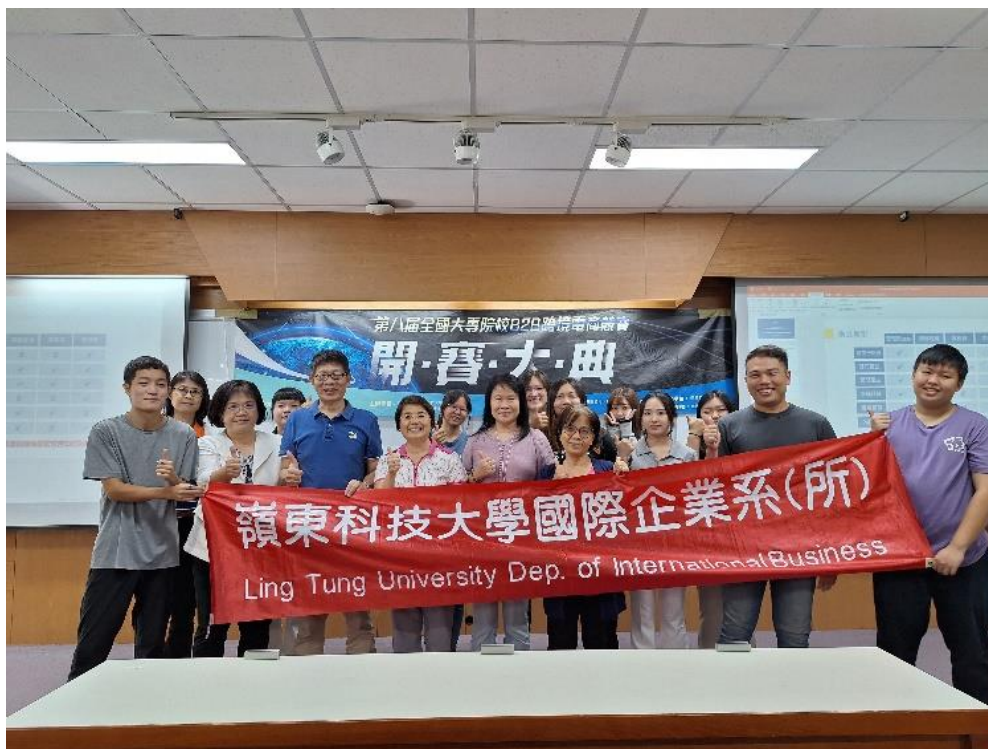
台中嶺東科技大學國際企業系承辦「第八屆全國大專院校 B2B 跨境電商競賽」中區競賽活動，辦理開賽大典暨專業培訓課程