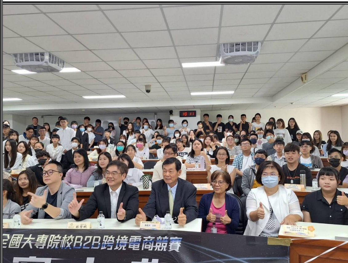
台中嶺東科技大學國際企業系承辦「第八屆全國大專院校 B2B 跨境電商競賽」中區競賽活動，辦理開賽大典暨專業培訓課程