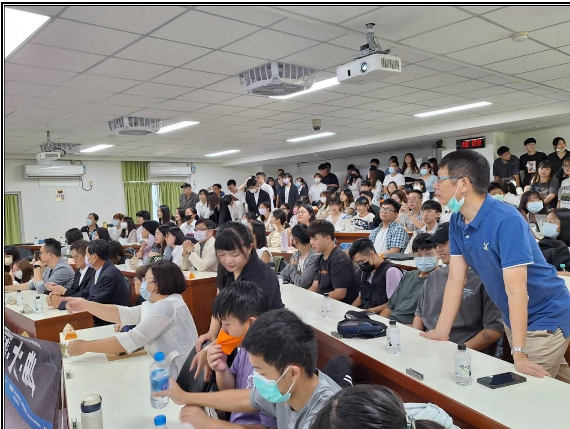
台中嶺東科技大學國際企業系承辦「第八屆全國大專院校 B2B 跨境電商競賽」中區競賽活動，辦理開賽大典暨專業培訓課程